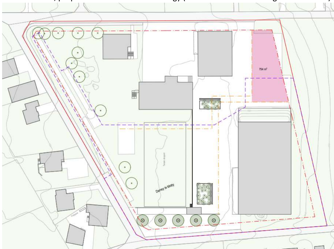
Figure 2 : Potentiel constructible sur la Parcelle 283 à Cugy

Contactée à ce sujet, la Municipalité de Cugy a d'ores et déjà donné son accord de principe pour le développement rapide des infrastructures secondaires dans le secteur, au vu des besoins déjà existants et ceux confirmés par le Plan de développement 2040 de l'ASICE. Les détails et conditions de mise à disposition du terrain communal cugiéran devront être discutés, établis et faire l'objet de préavis dédiés.